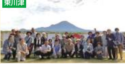
ワッハッハ ワッハッハー 笑顔☺