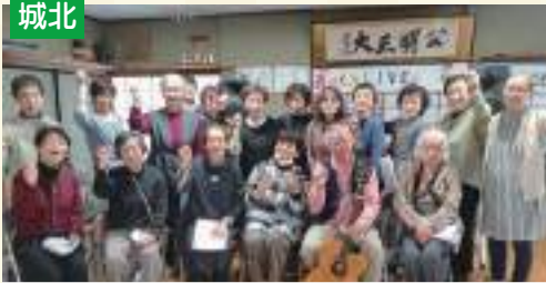
皆さんの元気につながるサロンを目指します♪