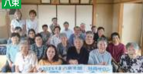
牡丹サロンでお待ちしています!