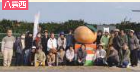
人と人のつながりを大切に