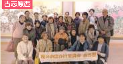
今年も楽しく仲間づくりにチャレンジ!