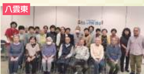
今年もみんなで活動しましょう!