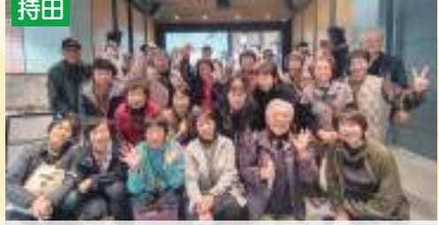
活動に参加して元気チャージ!