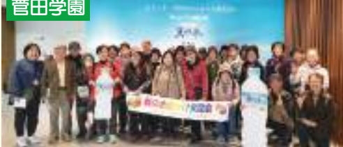
今年も皆さん健康でうまくいく様に頑張りましょう!