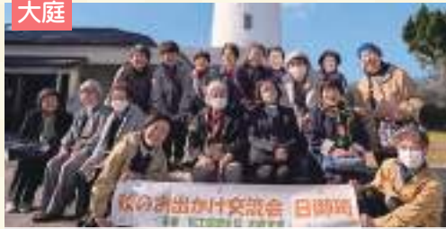
地域のつながりを大切に!