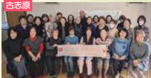
毎日のサロンで健康づくりを