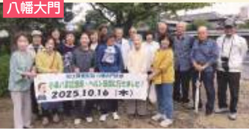
75周年に向けて頑張りましょう!!