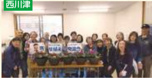
今年も運営委員一同力をあわせて企画していきます