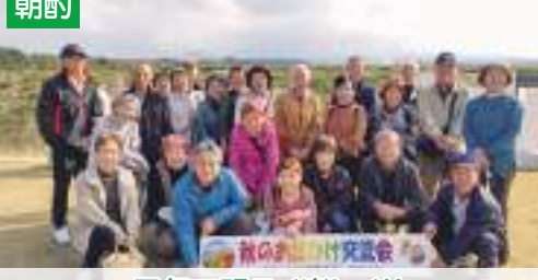
元気で明るく楽しく!!