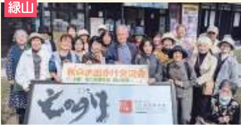
サロンで地域を元気に!