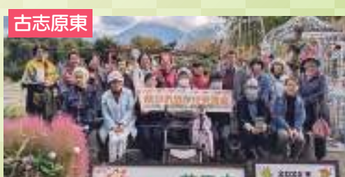
今年もえがおで楽しく!