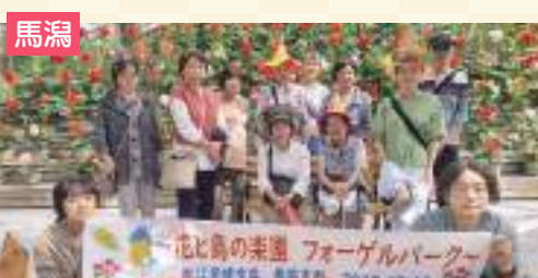
みんな健康で平和に過ごせますように