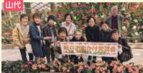
健康で元気に頑張りましょう!