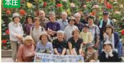
今年も素敵な1年に!